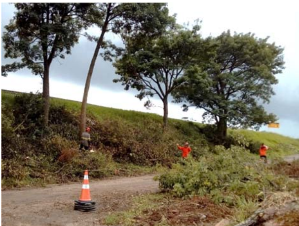
Equipe realizando supressão na margem da BR-290