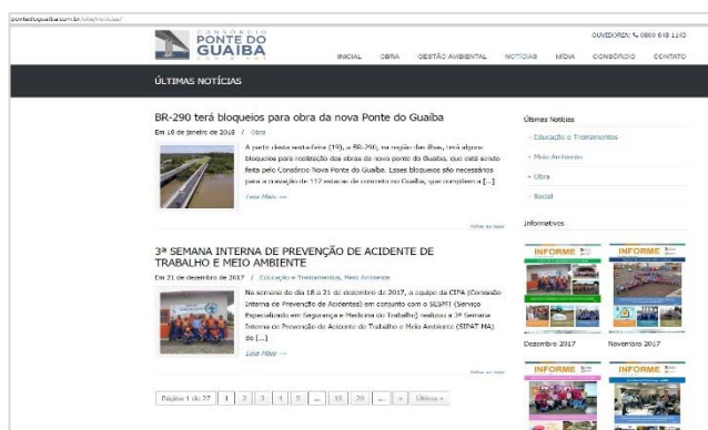
Página de notícias do website

Desde a implantação, em abril de 2015, o site teve 24.931 visitantes únicos, totalizando 41.097 acessos.