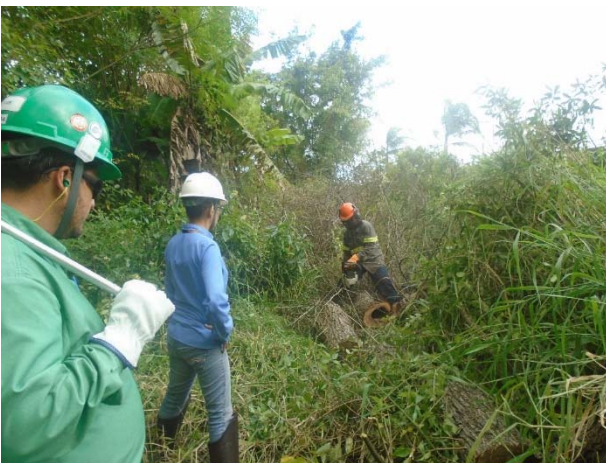
Equipe de meio ambiente no resgate de gambá-de-orelha-branca

A supressão vegetal, na faixa de domínio da Rodovia BR-290/116, trecho leste da Ilha das Flores, teve início no dia 11 de janeiro.