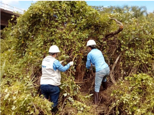
Equipe de meio ambiente sinalizando árvore imune ao corte, corticeira-do-banhado