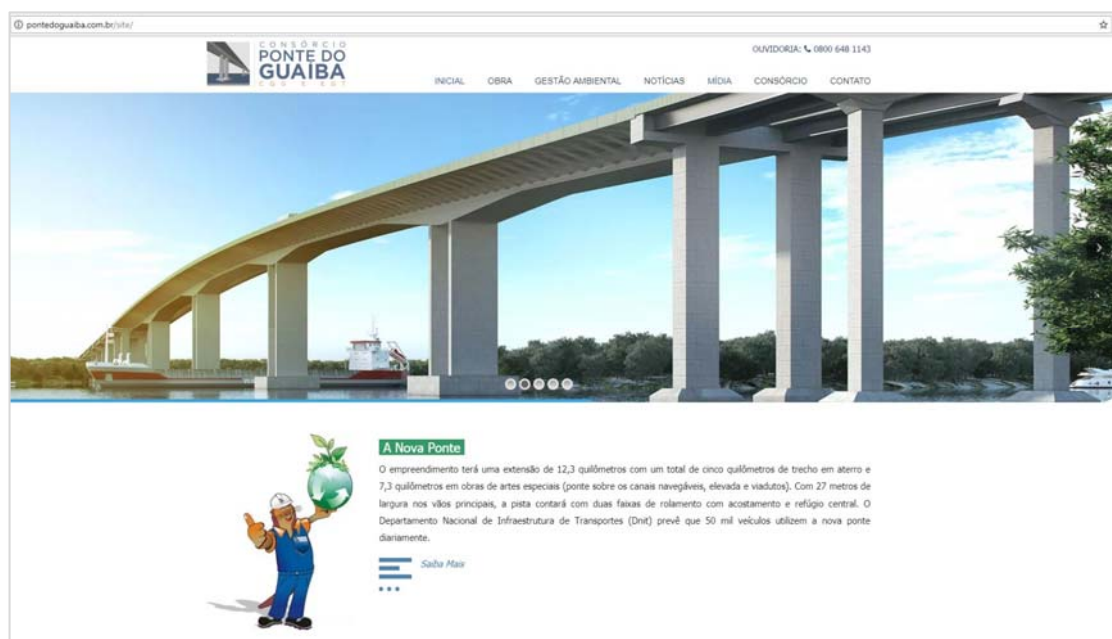
Página inicial do site do Consórcio Ponte do Guaíba

O Programa de Comunicação Social (PCS) do Consórcio Ponte do Guaíba visa promover meios adequados e relevantes de comunicação e interação social. O objetivo é estabelecer diálogos construtivos e entendimento entre os públicos afetados direta e indiretamente pela construção da ponte e os responsáveis pelo empreendimento.