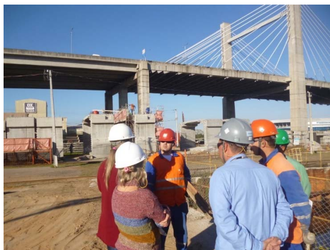
Entrevista com colaboradores da obra